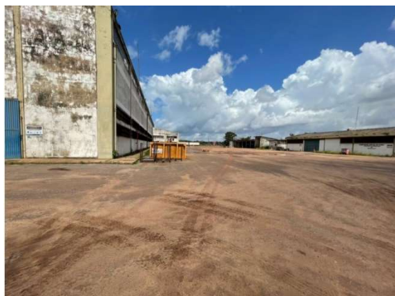
Figura 4 – Situação atual da área – VDC04 Fonte: Agência Porto Consultoria – 22/07/2021