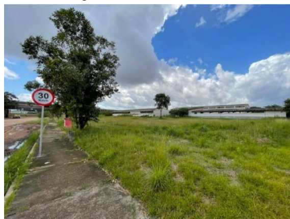
Figura 9 – Situação atual da área – VDC04 Fonte: Agência Porto Consultoria – 22/07/2021