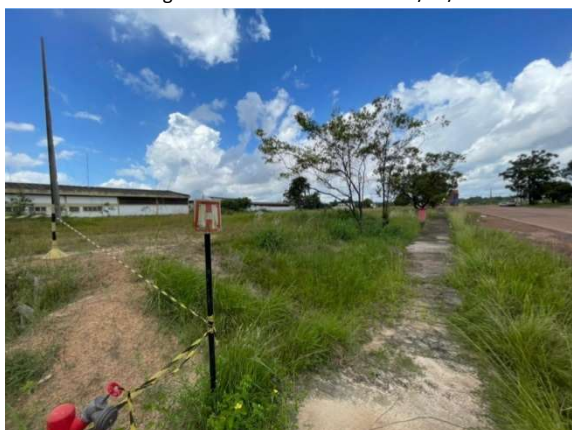
Figura 8 – Situação atual da área – VDC04 Fonte: Agência Porto Consultoria – 22/07/2021