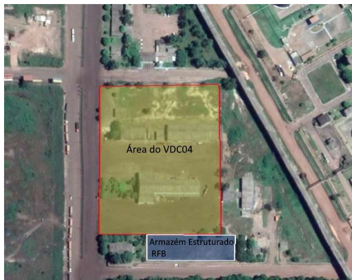
Figura 16– área para construção do armazém estruturado da RFB

O prédio da RFB deverá ter 2.055 metros e deve ser construído na área apresentada na figura 16. Destaca-se que a área está fora da área do arrendamento.