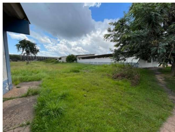
Figura 11 – Situação atual da área – VDC04 Fonte: Agência Porto Consultoria – 22/07/2021