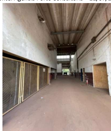
Figura 13 – Situação atual da área – VDC04 Fonte: Agência Porto Consultoria – 22/07/2021

A proposta de layout para o VDC04 no presente estudo, considera a necessidade de área para circulação de caminhões e segregação de carga de importação e de exportação, conforme observado na