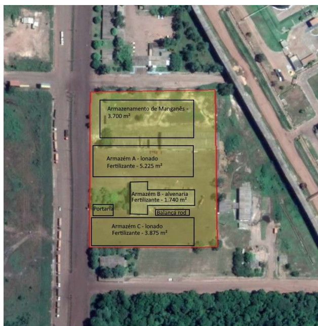
Figura 15– Layout da área VDC04