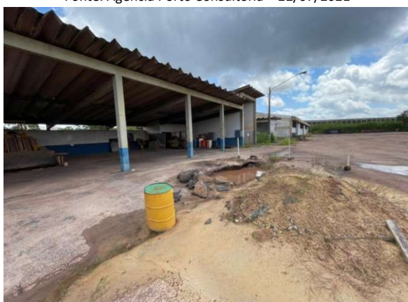
Figura 12 – Situação atual da área – VDC04 Fonte: Agência Porto Consultoria – 22/07/2021