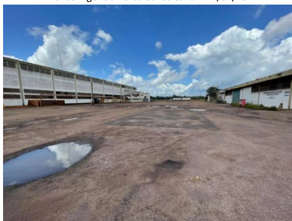
Figura 7 – Situação atual da área – VDC04 Fonte: Agência Porto Consultoria – 22/07/2021