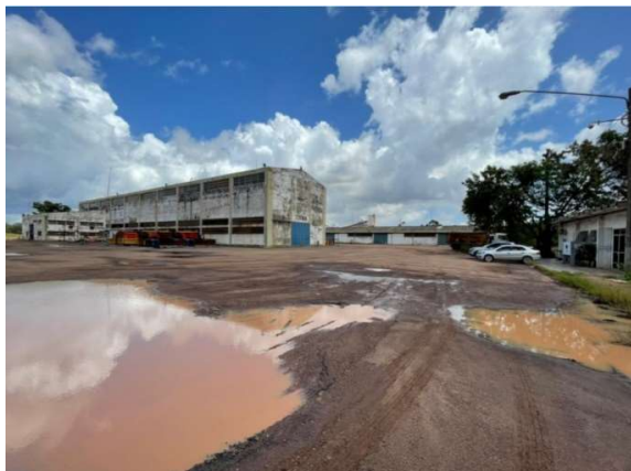
Figura 2 – Situação atual da área – VDC04

Segue situação atual das estruturas existentes no terminal: