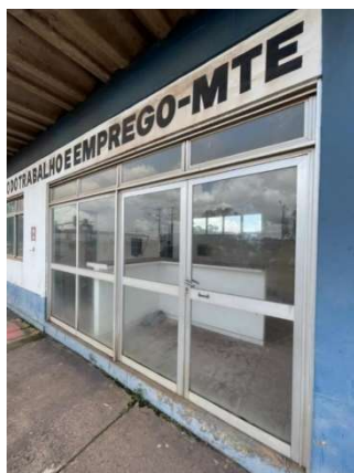
Figura 10 – Situação atual da área – VDC04 Fonte: Agência Porto Consultoria – 22/07/2021