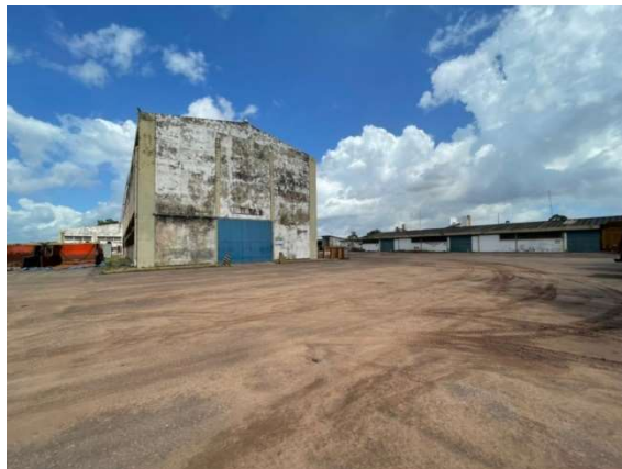
Figura 3 – Situação atual da área – VDC04 Fonte: Agência Porto Consultoria – 22/07/2021