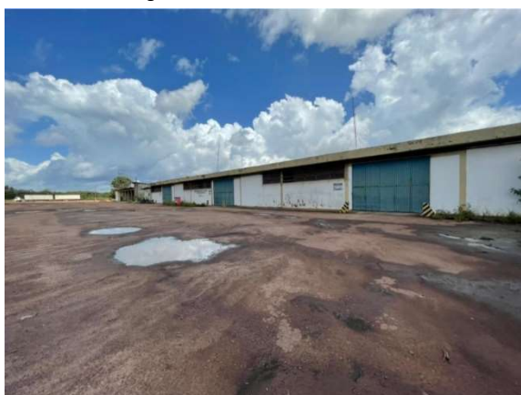
Figura 6 – Situação atual da área – VDC04 Fonte: Agência Porto Consultoria – 22/07/2021