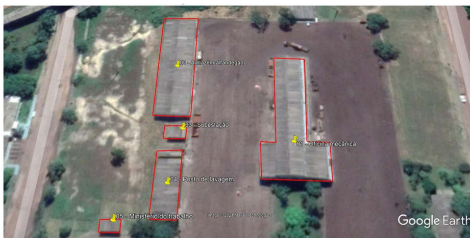
Figura 1 – Estruturas existentes no VDC04

No modelo do arrendamento, as únicas edificações que não serão demolidas são as denominadas 05 - Ministério do Trabalho e 01 - Oficina Mecânica, identificadas na Figura 1. As edificações serão incorporadas ao empreendimento como um armazém de fertilizantes e uma portaria de acesso.