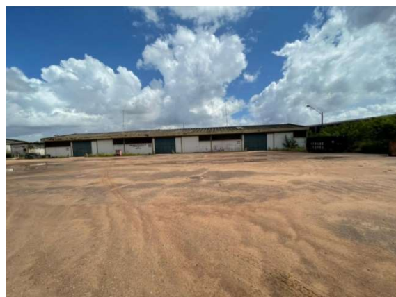
Figura 5 – Situação atual da área – VDC04 Fonte: Agência Porto Consultoria – 22/07/2021